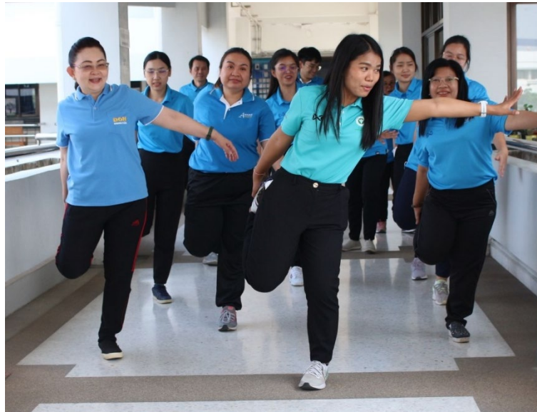
ภาพกิจกรรมการออกกำลังกายของบุคลากรสำนักคณะกรรมการผู้ทรงคุณวุฒิ